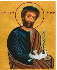
19, Saint Joseph