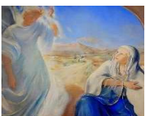
25, Annonciation du Seigneur