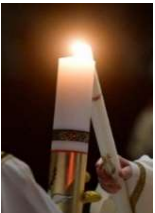
19, Vigile Pascale