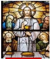
17, Jeudi Saint