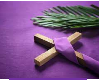
9, Premier dimanche de Carême