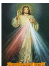
27, Divine Miséricorde