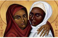
7, Saintes Perpétue & Félicité, martyres en Afrique romaine